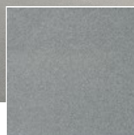
460 / Bloss / Hanf